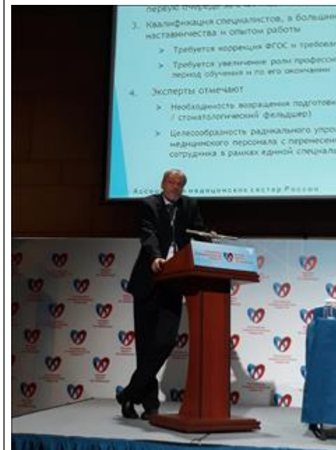
Фото Самойленко В.В. Фото Самойленко В.В.