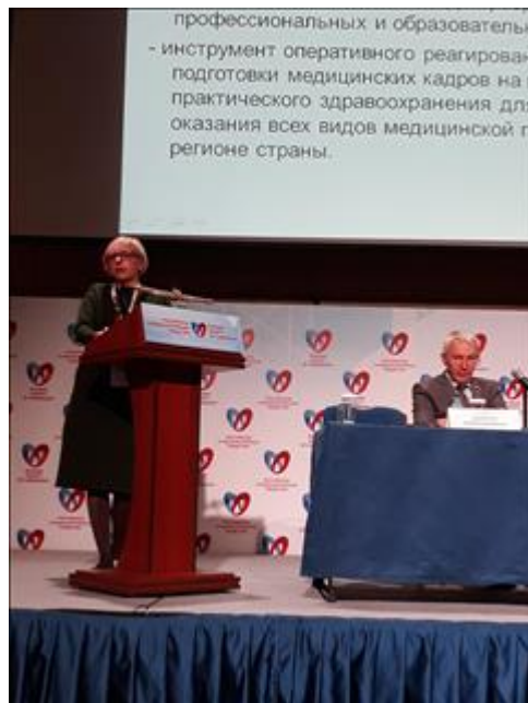
Фото Сироткиной О.В. Фото Сироткиной О.В.