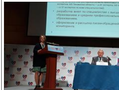
Фото Пармон E.B. Фото Пармон E.B.